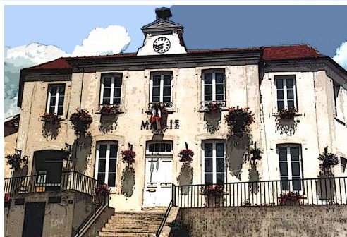
Mairie de Jouars-Pontchartrain Construite en 1866

Groupement paroissial de Neauphle-le-Château et Jouars-Pontchartrain, paroisse Saint Lin